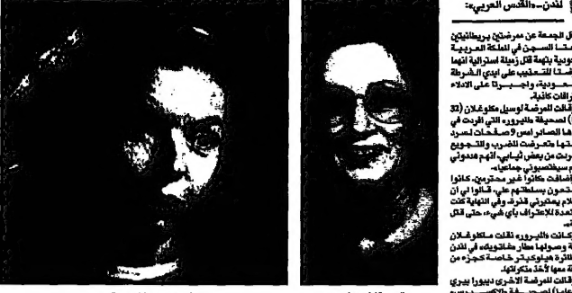
المدعي والمدعى عليه في قضية التشويه الإعلامي